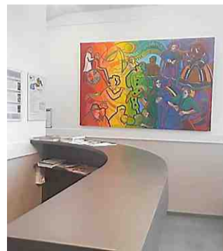
Une touche de modernité du meilleur effet.

Lamalou a la chance de posséder un cinéma d'art et d'essai en ville encore indépendant. Il était nécessaire de le mettre aux normes d'accessibilité pour les personnes à mobilité réduite, de moderniser la billetterie et de lui donner un coup de frais. C'est ce qui vient d'être fait avec une