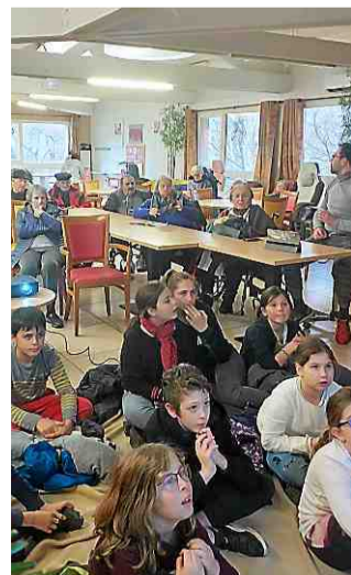
Jeunes et moins jeunes au coude-à-coude !

Jeunes et moins jeunes ont apprécié ce moment de convivialité et ont pu constater, par la même occasion, que les