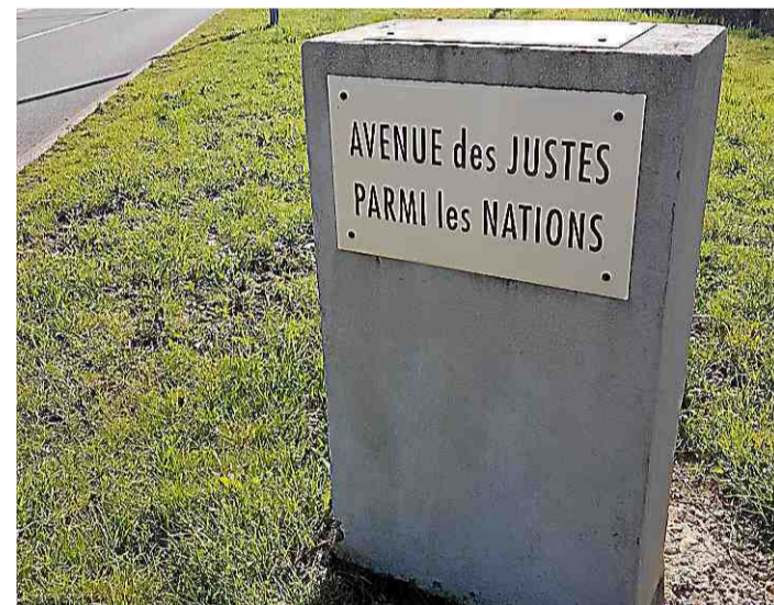
Le nom de Justes parmi les nations a été donné à une avenue de la ville.