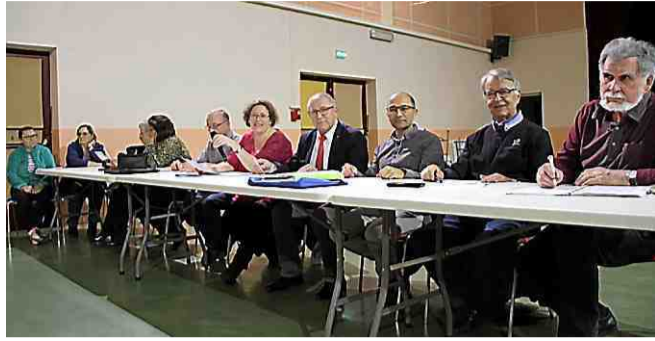
Le bureau de l'amicale a fait le point sur l'année 2019.

L'amicale des donneurs de sang s'est réunie en salle polyvalente pour sa traditionnelle assemblée générale de début d'année.